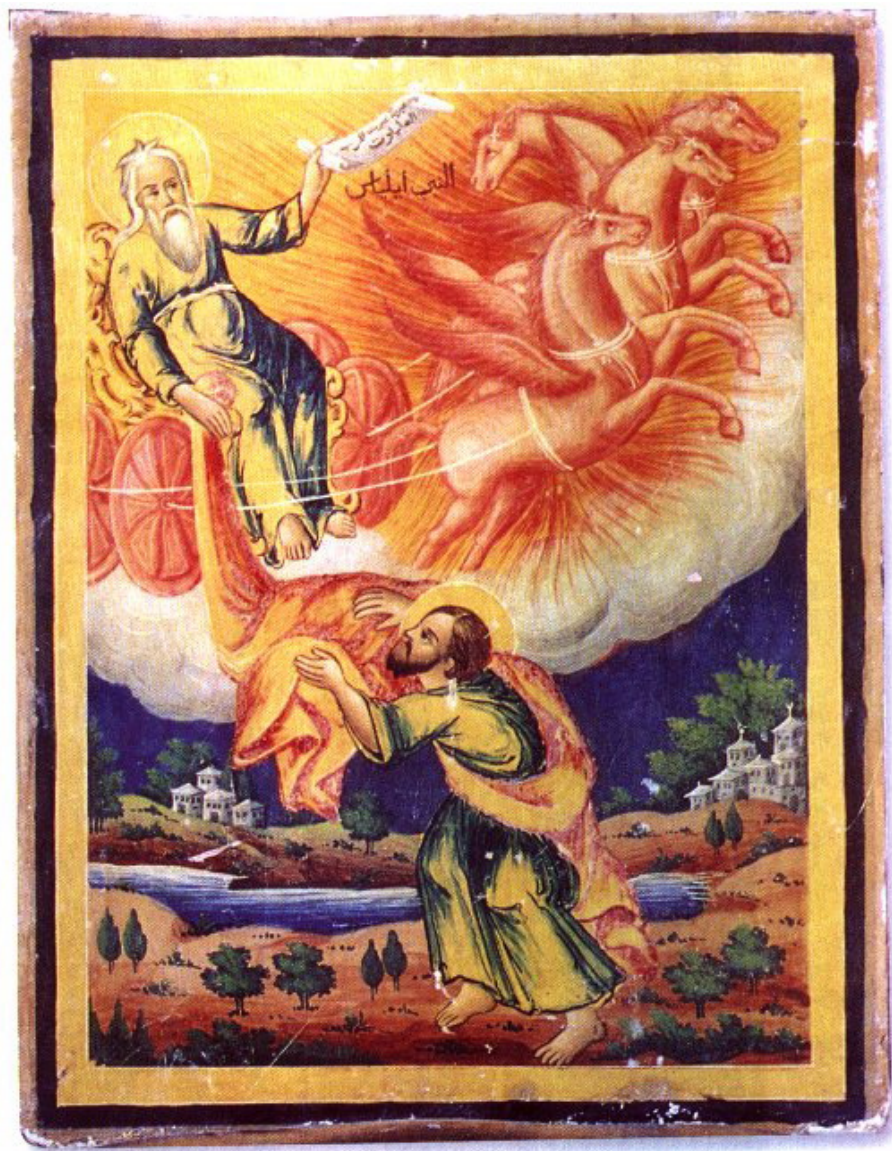
Слика 4: Свети Илија представљен на небу у својим ватреним кочијама попут приказа бога сунца Хелија, или Фаетона. На икони се види и ватрени плашт којим је по предању свети Илија ударио о земљу (Athnasiyu, 2002).

календара и краљева. Код сваког од њих може се приметити да су имали исте мотиве који се појављују код Мардука, само су временом избледели и мало променили форму, како би тренутни главни бог имао све најважније карактеристике.