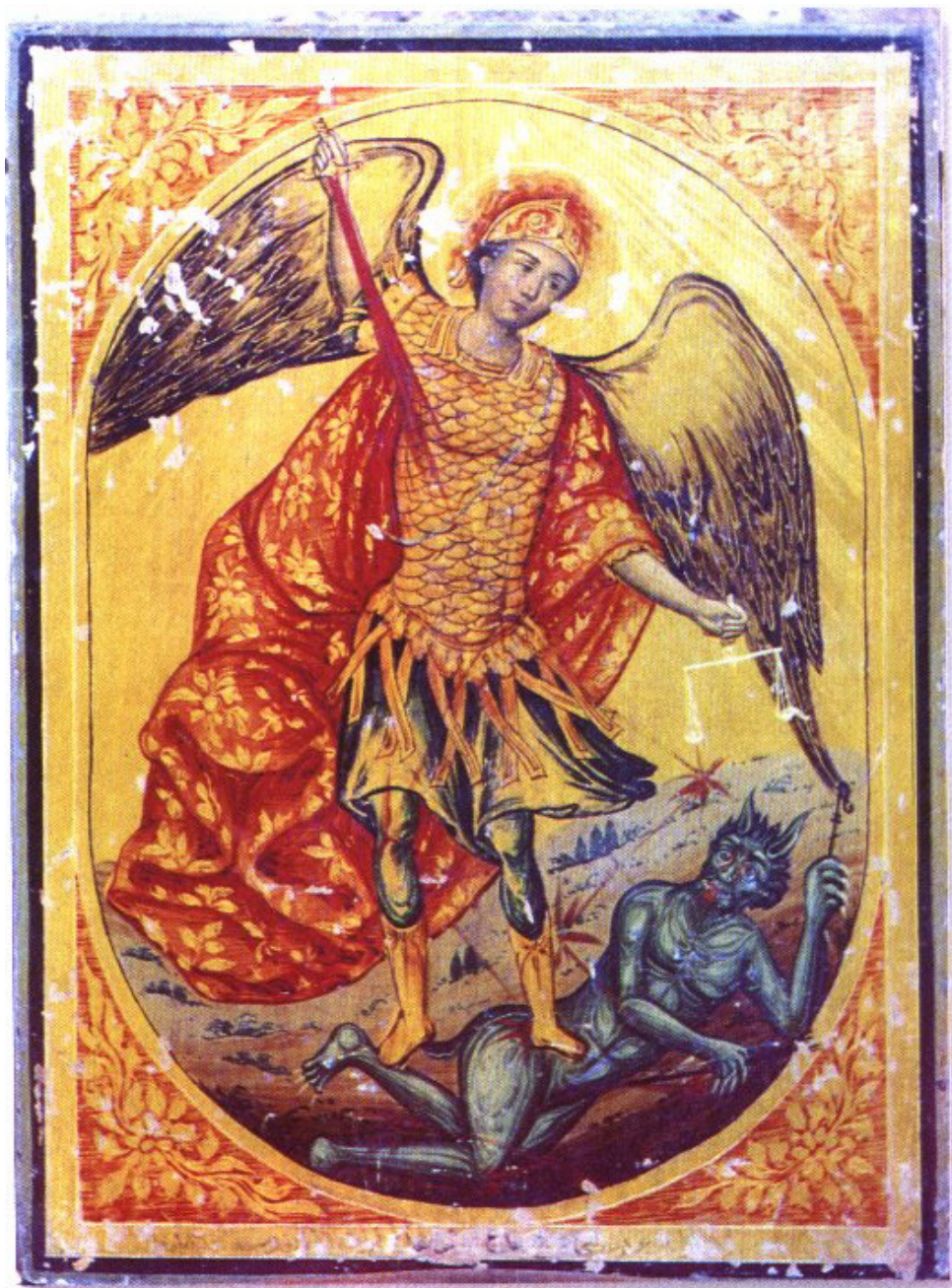
Слика 3: Архангел Михаило убија Бавола мачем у облику репа комете, представљени на икони из Сирије (Athnasiyu, 2002).