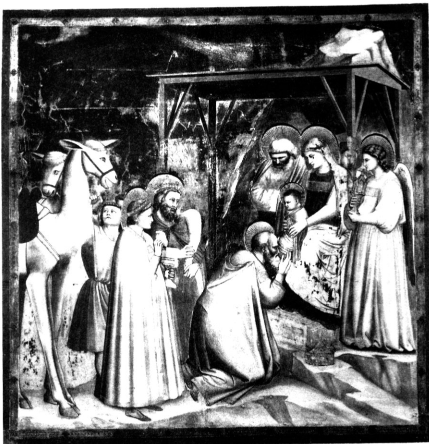
Слика 1: Ђотова (Giotto di Bondone) фреска из 1302. године у капели Скровењи (Scrovegni Chapel), у Падови, у Италији, са кометом у горњем централном делу слике. Фреска приказује долазак три мага која одају почит новорођеном Христу (Schechner, 1997).